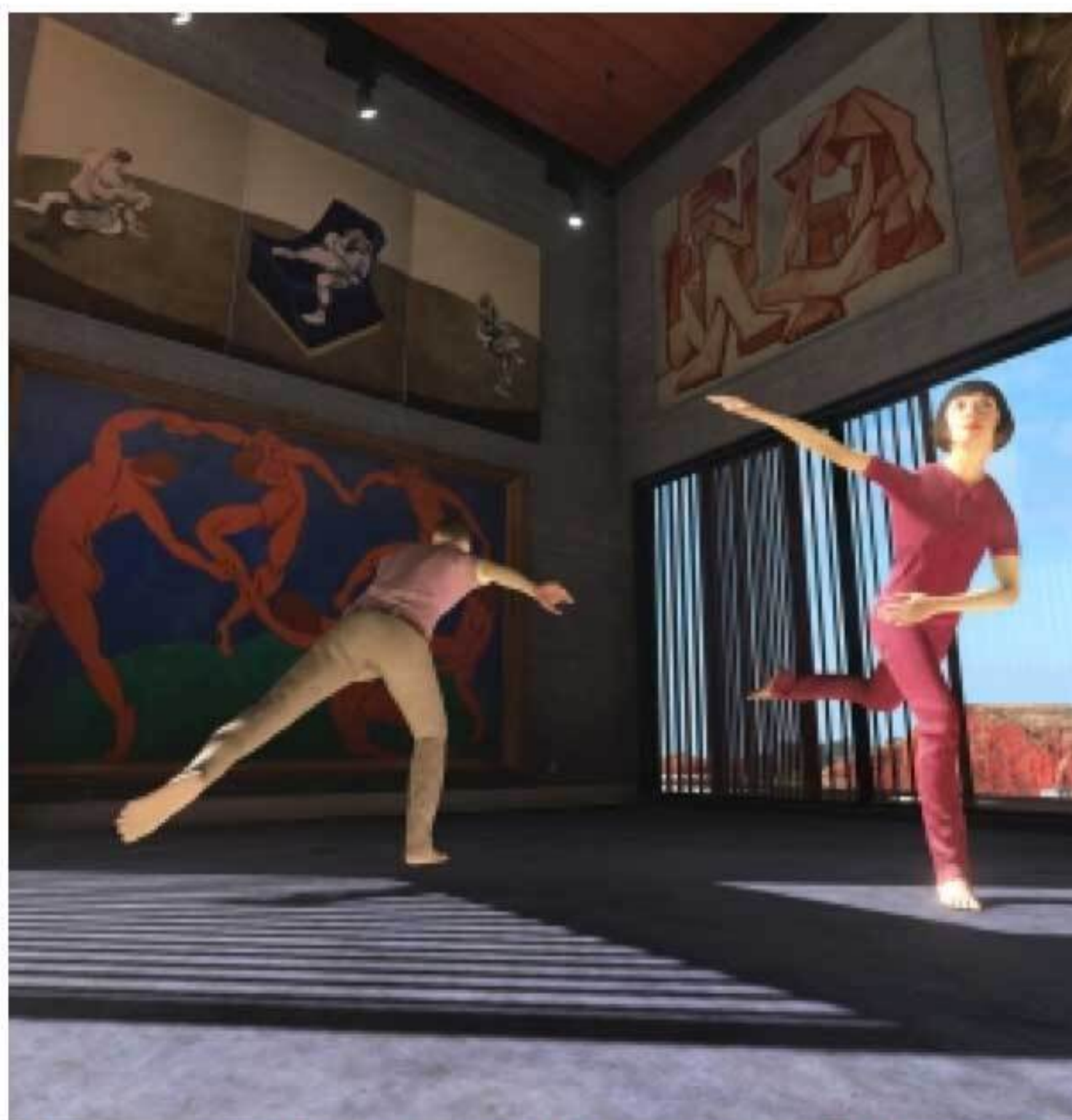
VR_I joue sur les rapports d'échelle, entre des danseurs gigantesques et des miniatures dansantes.