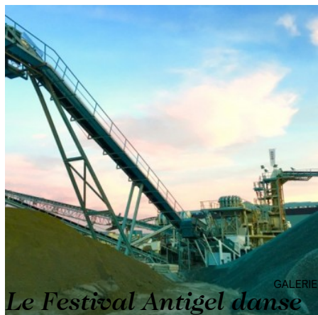
Le Festival Antigél danse avec les machines ( https://www.boleromagazin.ch/le-festival-antigel-danse-avec-les-camions/ )