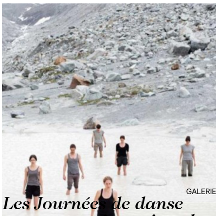
Les Journées de danse contemporaine suisse de retour à Genève ( https://www.boleromagazin.ch/les-journees-de-danse-contemporaine-suisse-de-retour-a-geneve/ )